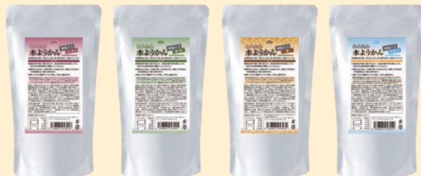
こしあん 抹茶 栗 白あん