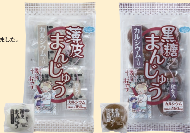
薄皮まんじゅう 黒糖まんじゅう