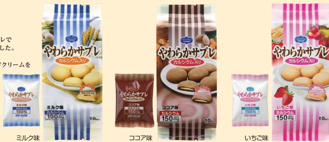
ミルク味 ココア味 いちご味

10枚入 サクッとソフトな食感のサブレでカスタードクリームを包みました。いちご味は、甘酸っぱいいちご果汁入りのカスタードクリームを使用しています。 ※大袋開封後も賞味期限までおいしくお召し上がりいただけます。