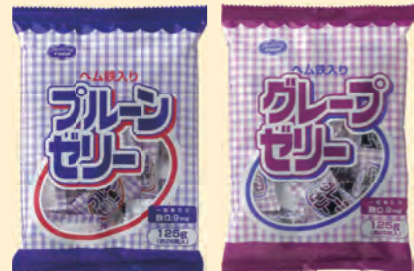
プレーン グレープ