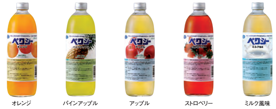
オレンジ パインアップル アップル ストロベリー ミルク風味