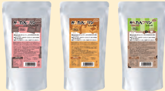
チョコレート味 キaramel味 コーヒー味