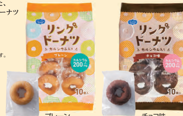
プレーン チョコ味

商品サイズ:直径約6.5×2cm ※美味しさを保つため、外装内にアルコール粉末製剤の小袋を封入しており、効力保持のため個包装に小さな穴を開けてあります。