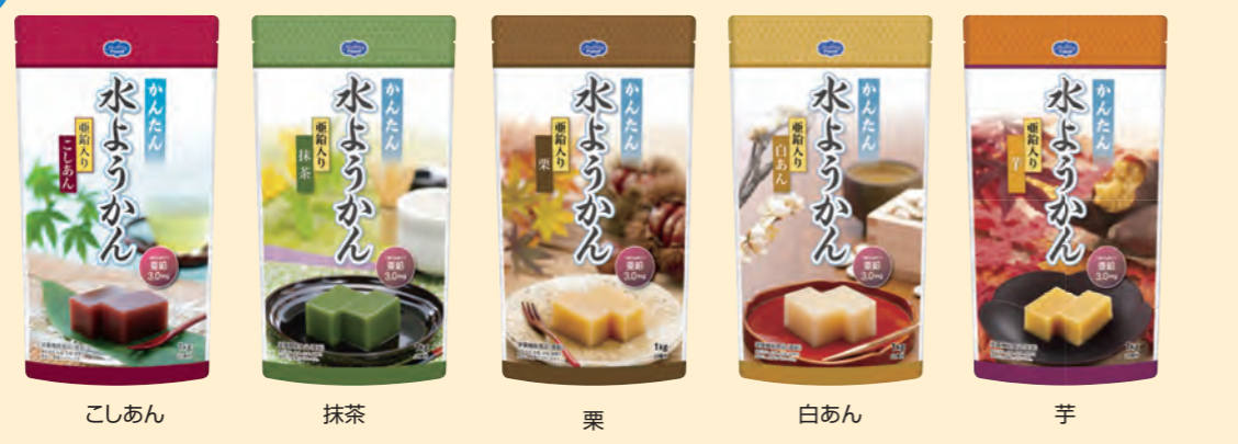
こしあん 抹茶 栗 白あん 芋