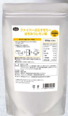
はちみつレモン味

レモンが香るさっぱりとした甘さのはちみつレモン味と、コンポートのような甘く濃厚な味わいのりんご味。